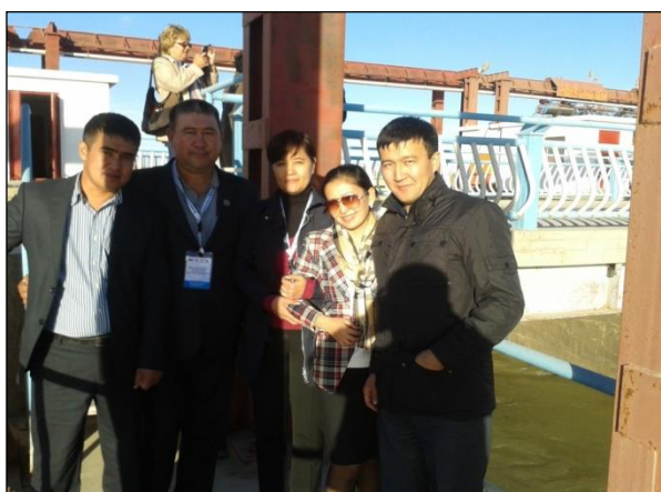
Выездное занятие на ГТС на реке Сырдарья