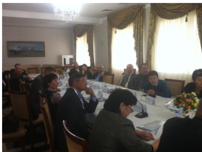
Сессию ведет Тренер ФАО о со-управлении рыбными ресурсами