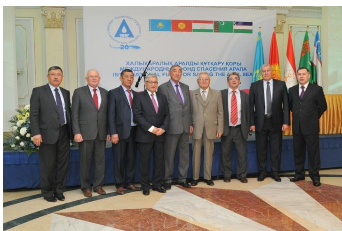
Гости и представители МИД РК и МФСА

В торжественной обстановке были вручены медали и почетные грамоты Министра иностранных дел РК присутствующим ветеранам МФСА.