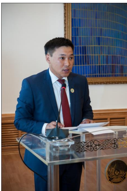
Приветствие от имени МИД РК г-н Дархан Нурсадыков