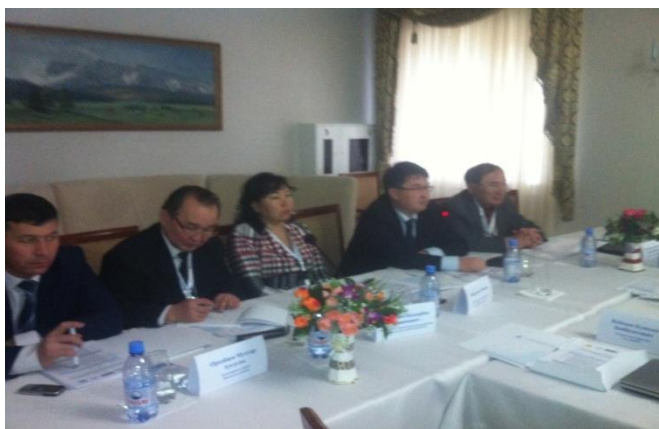
Гости семинара: Акимат Кызылординской области, Центр ОБСЕ в Астане, Комитет рыбного хозяйства МОСВР РК

Данное мероприятие направлено на повышение осведомленности местного населения о совместном управлении рыбными ресурсами и устойчивом развитии рыбной отрасли в возрождающемся от экологической катастрофы Аральском регионе.