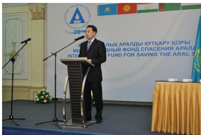
Выступление Заместителя Министра иностранных дел РК К.Сарыбай