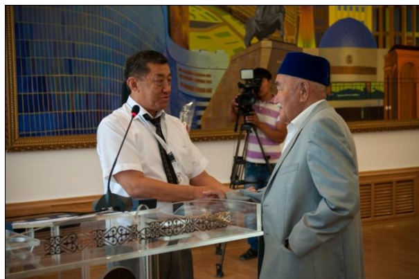
Церемония награждения памятными медалями ИК МФСА и грамотами ИД МФСА