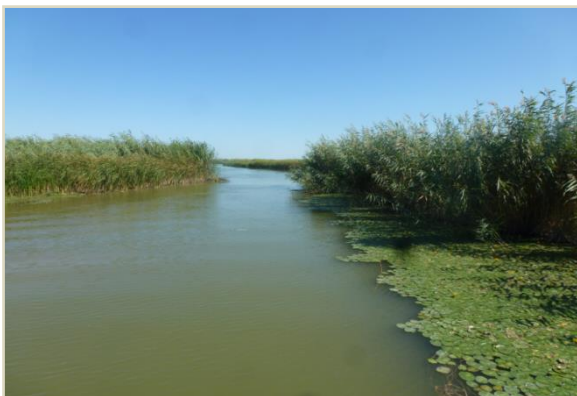
Новая популяция Nymphoides peltatum

Мероприятие (1) Мониторинг биоразнообразия водно-болотных угодий, формирующихся в авандельте реки Сырдарья: Собран материал для разработки картографических моделей с целью составления карт экосистем и карт распределения редких и эндемичных видов проектной территории (авандельте реки Сырдарьи, морской акватории Малого Арала, прибрежной полосе, на территории рамсарских водно-болотных угодий). Экспертная группа провела сравнительный анализ состояния Рамсарских угодий на основе инвентаризации био-разнообразия экосистем авандельты Сырдарьи и Малого Арала. Данные 2011 года были использованы в качестве базовой информации, так как мониторинг 2011 года явился первым действием подобного рода после наполнения Малого Арала и формирования новой авандельты Сырдарьи. Эко-мониторинг 2013 года выявил заметные колебания в количественном составе некоторых популяций - некоторые виды уменьшились, в то время как выросли по численности другие виды. Особую озабоченность вызывает исчезновение лебедя и уменьшение численности других видов водоплавающих птиц. В связи с тем, что мониторинг проводился только один раз (летом), экспертам не удалось получить более полную орнитологическую картину, поскольку необходимо проводить наблюдение, как минимум, два раза в год – весной и в конце лета.