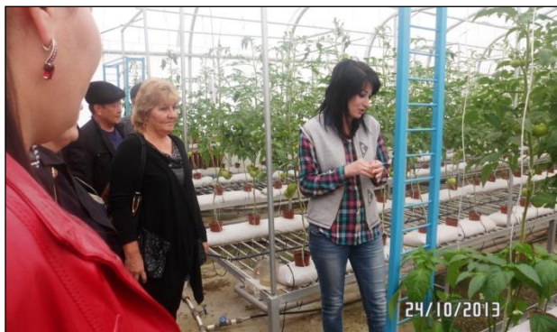
Выездное занятие в тепличном хозяйстве Кызылординского Государственного Университета им. Коркыт ата

Ожидается, что последующие тренинговые курсы будут предназначены для широкого круга специалистов – водников, включая лиц, определяющих водную политику и, принимающих решения, влияющих или формирующих ход и содержание современных реформ в обеспечении экологической безопасности в целом, и безопасности водных ресурсов, в частности.